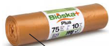
Ulkoastian suojaussi (pienastia-asiakkaat)